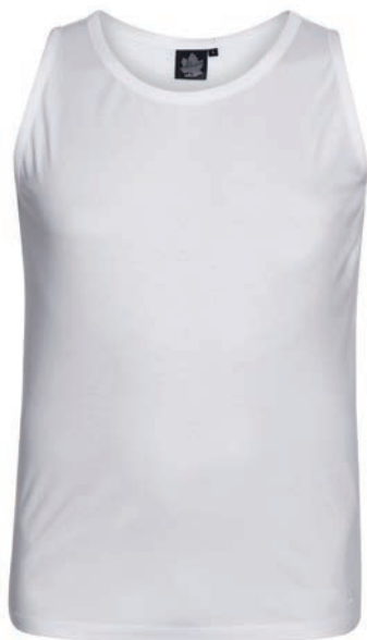
0076 white XXL - 10XL