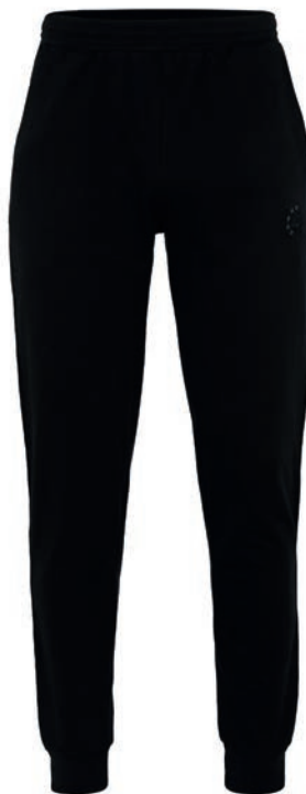
0077 black S - 10XL