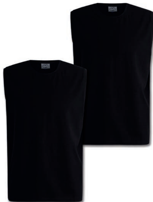
0077 black M - 10XL