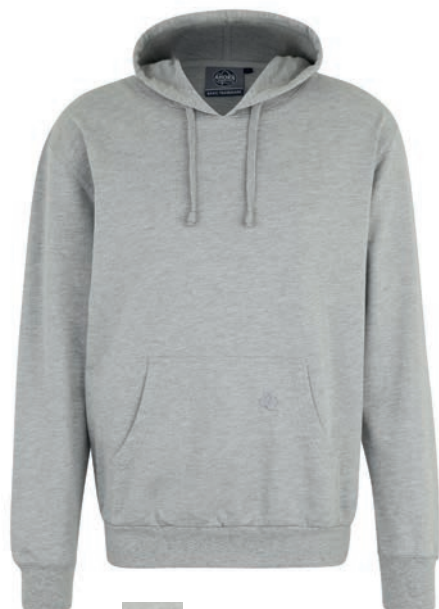
0069 greymelange* 80% baumwolle/20% polyester M - 10XL