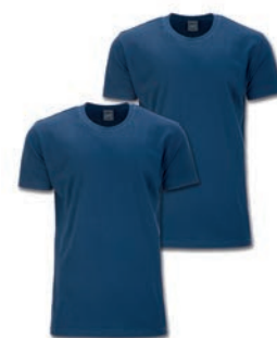
0160 alpine blue M - 10XL