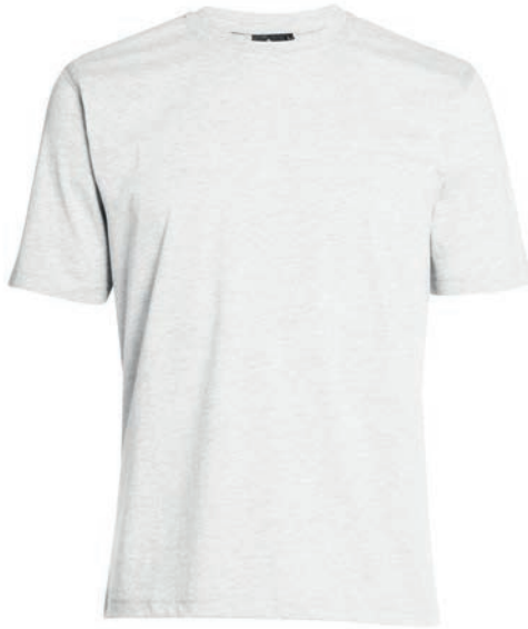
0076 white M - 10XL