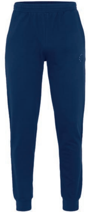
0160 alpine blue XL - 10XL