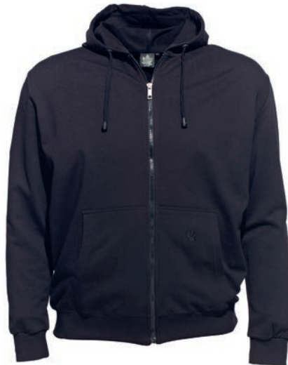
0077 black L - 10XL