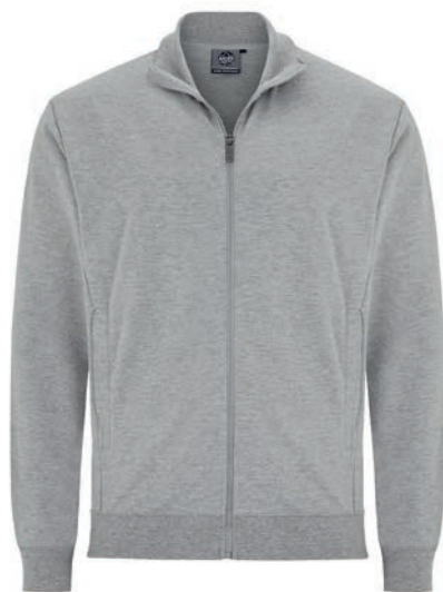
0069 greymelange* 80% baumwolle/20% polyester M - 6XL