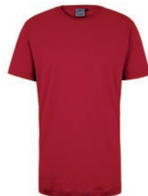
0200 cayenne red M - 10XL