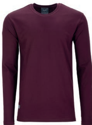
0230 maroon red L - 10XL