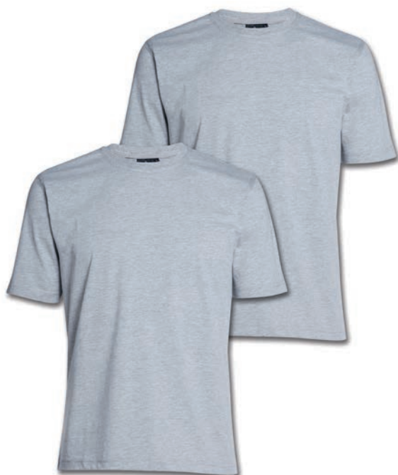
0069 greymelange* 80% baumwolle/20% polyester M - 10XL