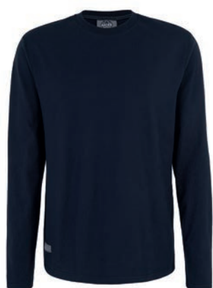
0544 dark blue M - 10XL