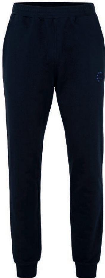
0544 dark blue S - 10XL