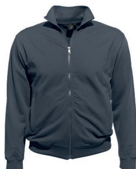
0143 iron grey M - 10XL

100% Baumwolle, Feinfutter, ca. 270 g/m 2