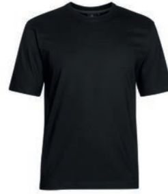
0077 black S - 10XL