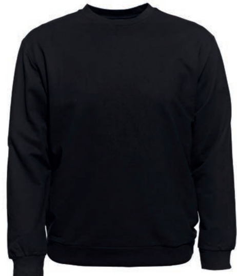
0077 black S - 10XL

100% Baumwolle, Feinfutter, ca. 270 g/m 2 Rundhals mit Bündchen, Hals, Ärmel und Bund mit Elasthan verstärkt, Ahorn Fähnchen linke Seite