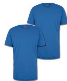
0048 nebulas blue M - 10XL

100% Baumwolle, Single Jersey, ca. 170 g/m 2 Ideal für Sport und Freizeit, Elasthanbündchen am Hals, Nackenband, schmales Halsbündchen. Ahorn Weblabel linker Arm