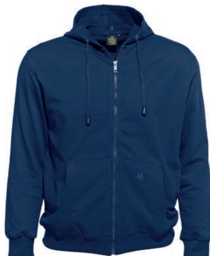
0160 alpine blue L - 10XL