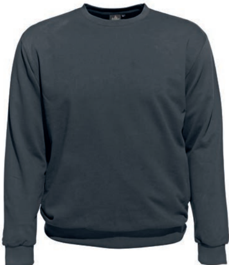
0143 iron grey L - 10XL