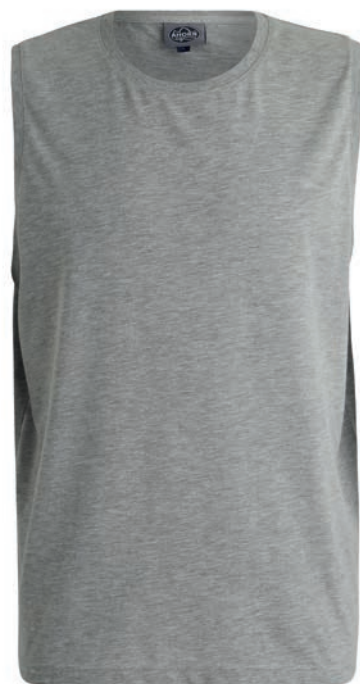
0069 greymelange* 80% baumwolle/20% polyester L - 10XL