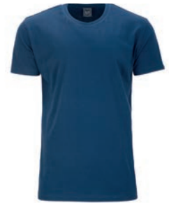
0160 alpine blue M - 10XL