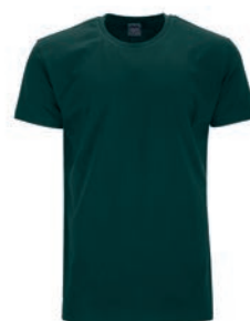
0270 bottle green M - 10XL