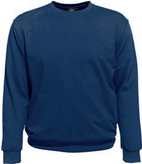
0160 alpine blue L - 10XL