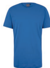
0048 nebulas blue M - 10XL

100% Baumwolle, Single Jersey, ca. 170 g/m 2 Ideal für Sport und Freizeit, Elasthanbündchen am Hals, Nackenband, schmales Halsbündchen. Ahorn Weblabel linker Arm