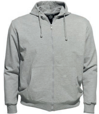
0069 greymelange* 80% baumwolle/20% polyester L - 8XL