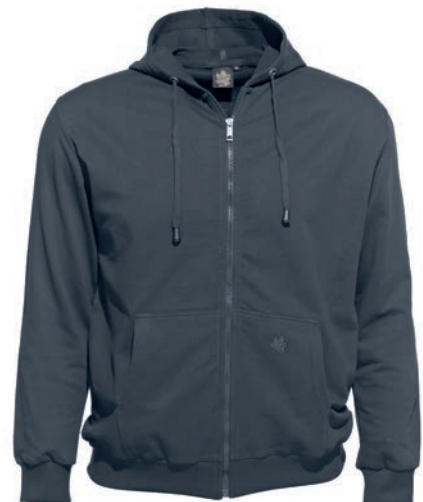
0143 iron grey L - 10XL