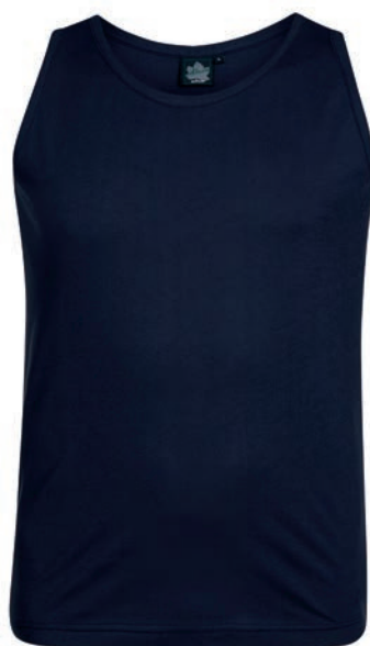
0544 dark blue XXL - 10XL