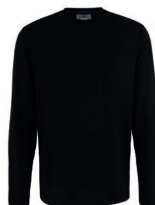
0077 black M - 10XL

100% Baumwolle, Heavy Jersey, ca. 180 g/m 2