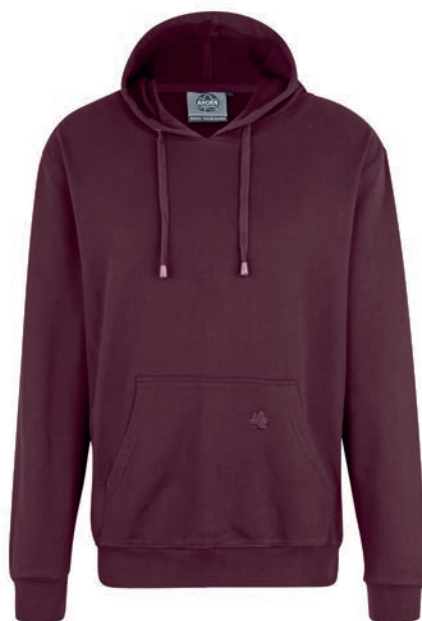
0230 maroon red M - 10XL