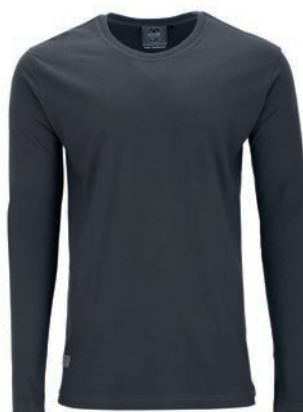
0143 iron grey M - 10XL