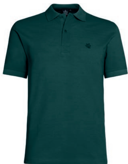
0270 bottle green M - 10XL