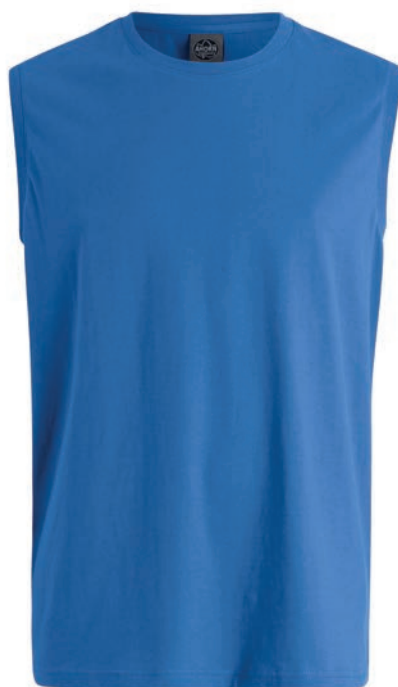
0048 nebulas blue L - 10XL