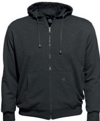
0070 anthrazit-melange* 70% baumwolle/30% polyester L - 10XL