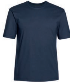
0544 dark blue M - 10XL