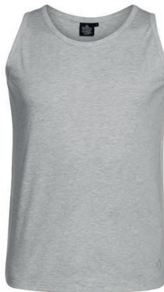
0069 greymelange* 80% baumwolle/20% polyester XXL - 10XL