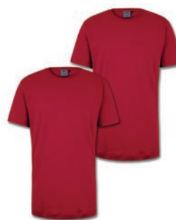
0200 cayenne red M - 10XL