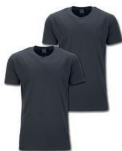
0143 iron grey M - 10XL