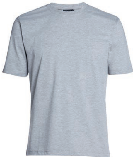
0069 greymelange* 80% baumwolle/20% polyester M - 10XL