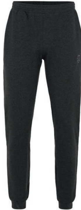
0070 anthrazit-melange* 70% baumwolle/30% polyester S - 10XL