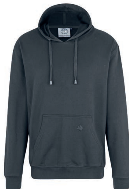
0143 iron grey L - 10XL