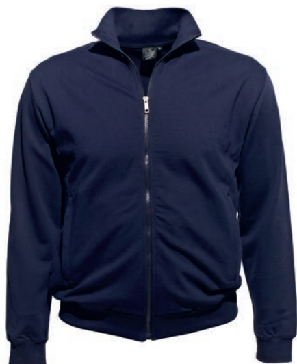
0544 dark blue M - 10XL