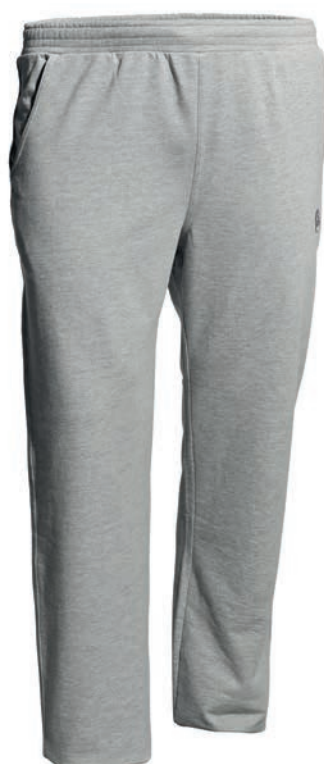
0069 greymelange* 80% baumwolle/20% polyester S - 10XL

100% Baumwolle, Feinfutter, ca. 270 g/m 2 Lange Hose, Gummibund mit Kordelzug, 2 Schubtaschen, Ahorn Logo Stick ton-in-ton linkes Bein, Flatlocknaht