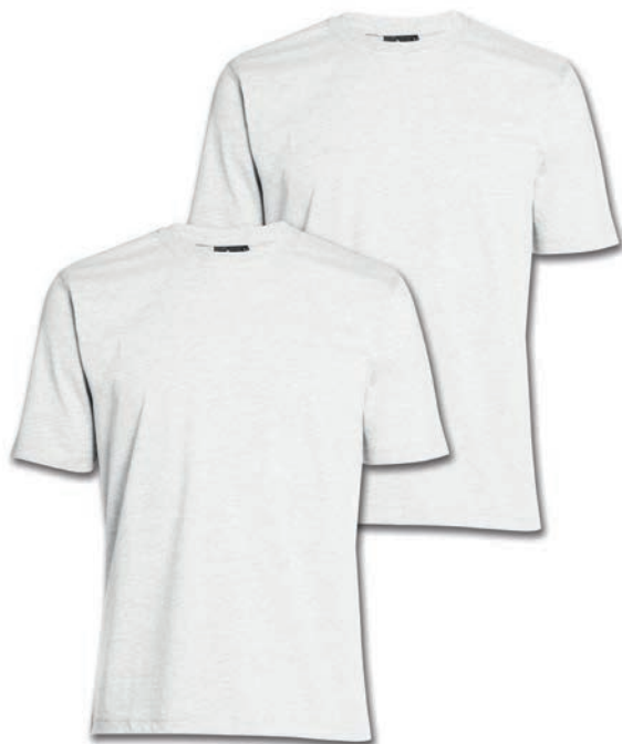
0076 white M - 10XL