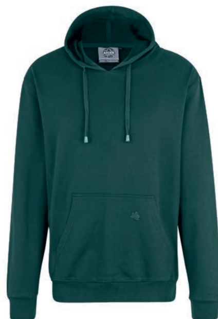
0270 bottle green L - 10XL

100% Baumwolle, Feinfutter, ca. 270 g/m 2