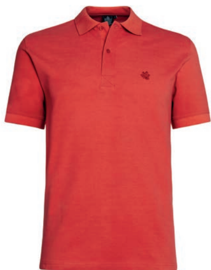
0086 baked apple red L - 6XL