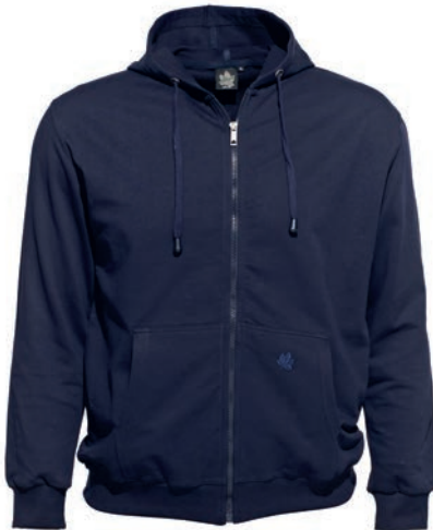
0544 dark blue L - 10XL