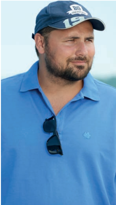
Polo_Shirt „NOS“ Art. 318 390

100% Baumwolle, Piqué zweifädig, ca. 220 g/m 2 Klassischer Schnitt, 1/2 Arm, Knopfleiste mit 2 Knöpfen, 2 Seitenschlitze, Ahorn Stickerei linke Brust ton-in-ton