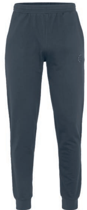
0143 iron grey XXL - 10XL

100% Baumwolle, Feinfutter, ca. 270 g/m 2 Lange Hose, Gummibund mit Kordelzug, Bündchen mit Elasthan am Beinende, 2 Schubtaschen, Ahorn Logo Stick ton-in-ton linkes Bein