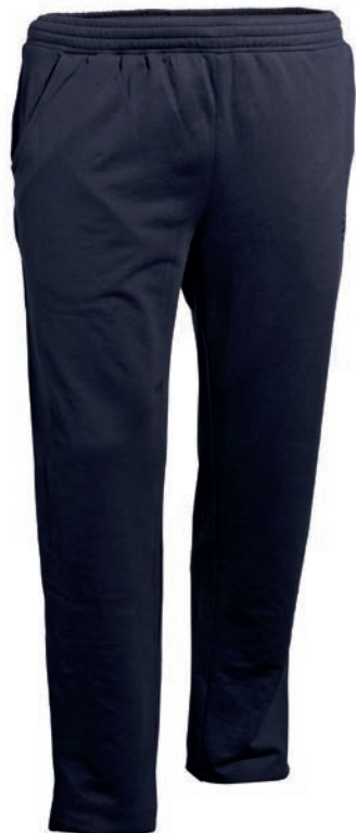
0544 dark blue S - 10XL