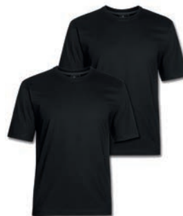
0077 black S - 10XL