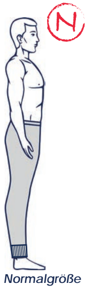
Basic_Sweat_Hose_mit Bündchen Art. 427 303