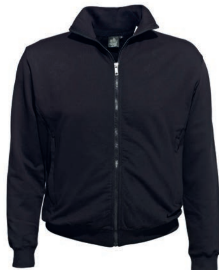
0077 black M - 10XL