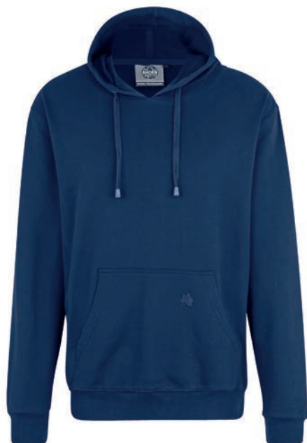
0160 alpine blue L - 10XL