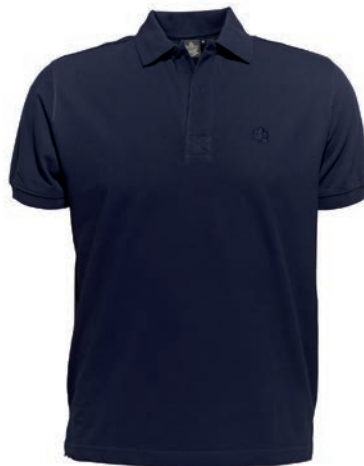
0044 blue S - 10XL