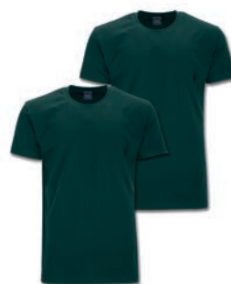
0270 bottle green M - 10XL