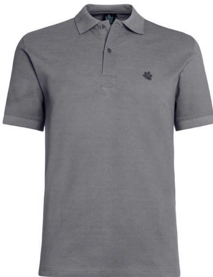
0110 steel grey M - 10XL