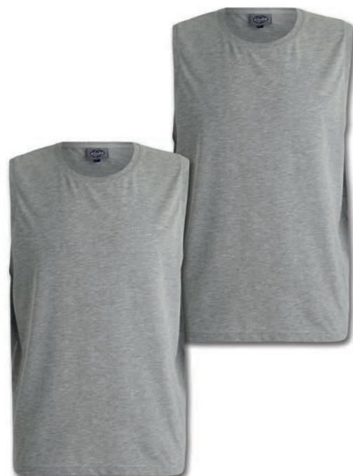
0069 greymelange* 80% baumwolle/20% polyester L - 10XL

100% Baumwolle, Single Jersey, ca. 170 g/m 2