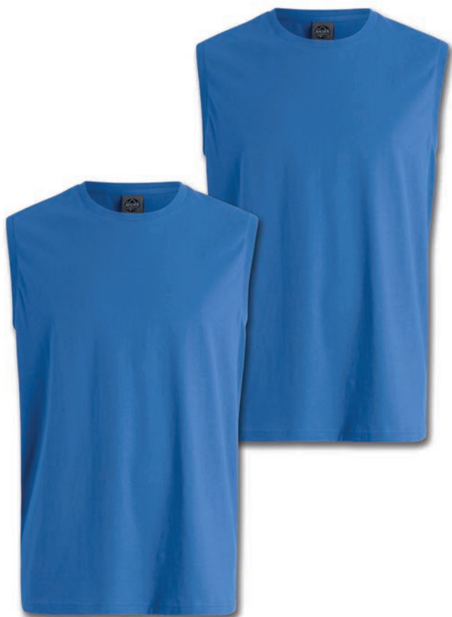
0048 nebulas blue L - 10XL