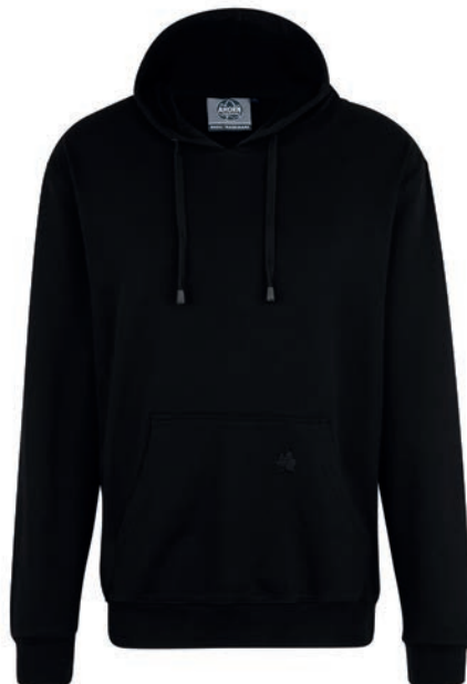
0077 black M - 10XL