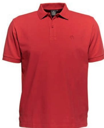
0200 cayenne red M - 10XL