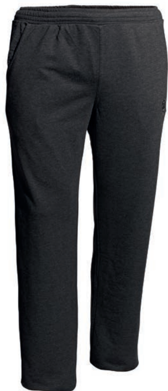
0070 anthrazit-melange* 70% baumwolle/30% polyester S - 10XL