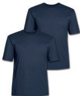
0544 dark blue M - 10XL