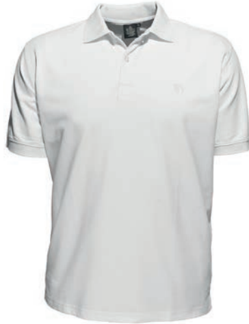
0076 white/kochfest S - 10XL