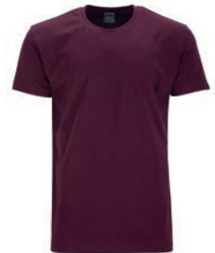
0230 maroon red M - 10XL