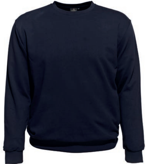
0544 dark blue S - 10XL