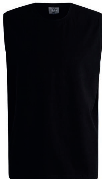
0077 black M - 10XL

100% Baumwolle, Single Jersey, ca. 170 g/m 2 Klassischer Schnitt, Elasthanbündchen am Hals und Ärmelausschnitt sorgen für Formstabilität und hohen Tragekomfort. Ahorn Weblabel am Saum. Nackenband