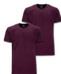
0230 maroon red M - 10XL