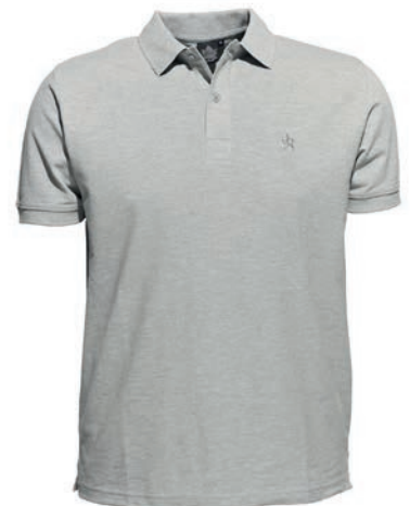
0069 greymelange* 80% baumwolle/20% polyester M - 10XL