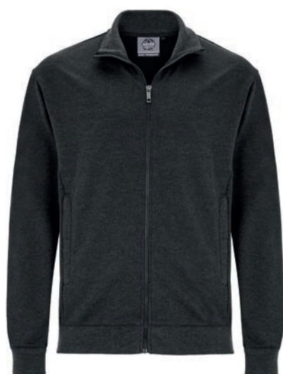
0070 anthrazit-melange* 70% baumwolle/30% polyester M - 10XL