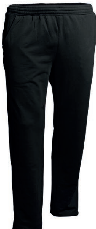
0077 black S - 10XL