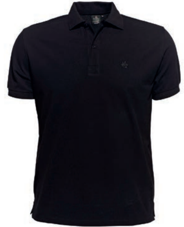
0077 black S - 10XL