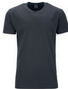
0143 iron grey M - 10XL