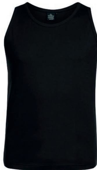
0077 black L - 10XL

100% Baumwolle, Single Jersey, ca. 170 g/m 2 Ideal für Sport und Freizeit, Ärmelausschnitt und Hals sorgfältig gesäumt, schmales Halsbündchen, Ahorn Outline-Stickerei ton-in-ton am Saum links