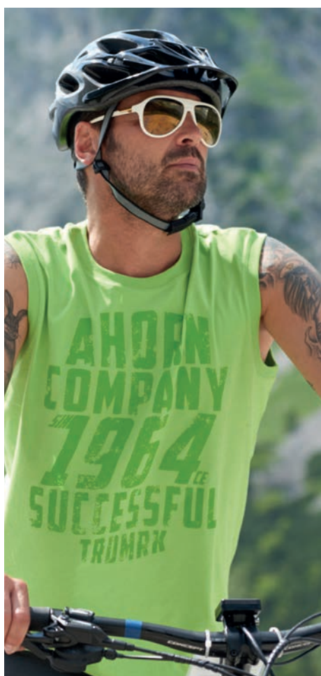
Einzel Tank Top „EASY LINE“ Art. 274 761-EP